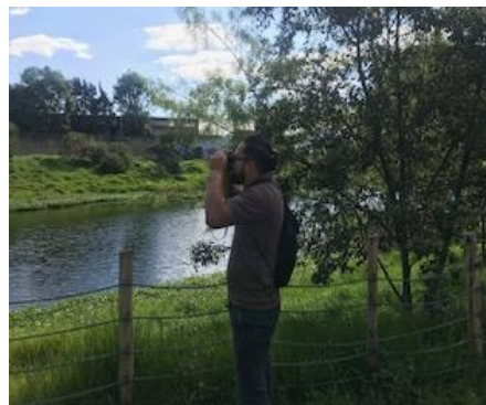
Foto 20: Monitoreo comunitario con la organización Conspiración Fecha: 07/12/2018