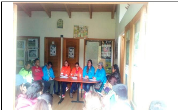
Foto 119: Mesa territorial del mes de Marzo, socialización de las actividades realizadas en el humedal La Vaca y otros temas. Fecha: 06/03/2018