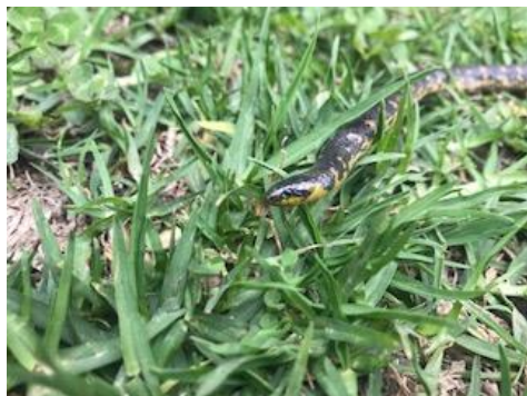
Foto 15: Atractus crassicaudatus (Culebra sabanera). Fecha: 29/04/2018.