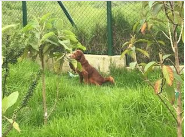
Foto 63: Identificación de canino dentro del humedal, sector 1 Fecha: 16/04/2018