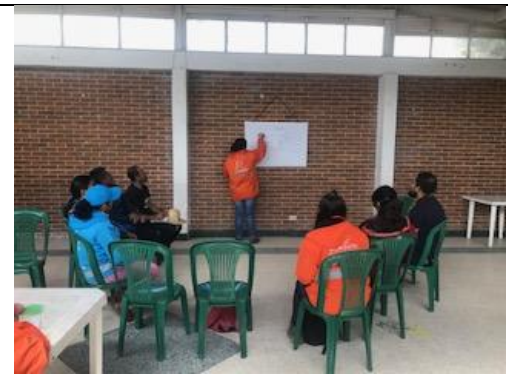
Foto 68: Participación de la comunidad en la construcción del diseño del sector sur del humedal. Fecha: 16/03/2018.

Foto 69: Tercera reunión para el diseño conjunto del sector sur del humedal. Fecha: 22/05/2018