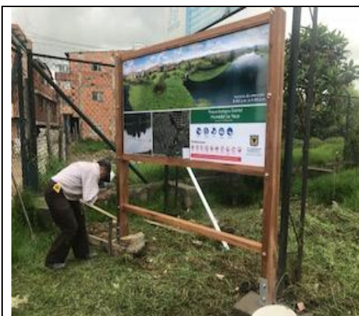
Foto 80: Instalación Señalética tipo I (informativa) sector 2 del humedal La Vaca. Fecha: 30/05/2018