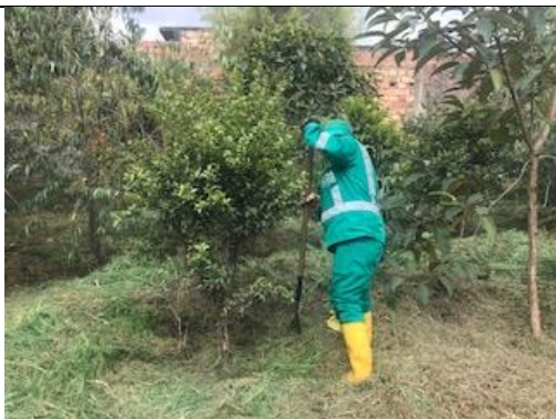
Foto 86: Mantenimiento individuos menores a 2m en la zona de preservación Fecha: 26/01/2018.