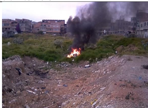
Foto 105: Conato provocado por habitante de calle en el sector sur del PEDH. Fecha: 06/09/2018.