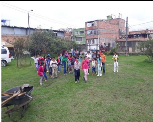
Foto 31: Actividad con estudiantes de la Universidad Uniminuto en el cierre del mes del agua. Fecha: 08/04/2018