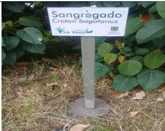
Foto 82: Intalación señalética tipo IV (prohibiciones), sector 2 del humedal La Vaca Fecha: 08/06/2018