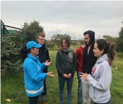
Foto 23: Recorrido con los estudiantes de la Universidad Javeriana, eje temático Biodiversidad y proceso de recuperación del humedal la Vaca. Fecha: