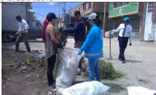
Foto 98: Jornada de limpieza y recuperación del Ingreso al humedal La Vaca, sector norte Fecha: 04/03/2018