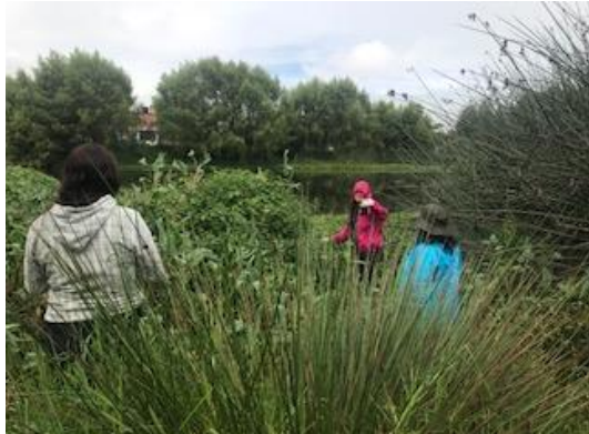
Foto 9: Toma de muestra de agua, sector 3 del humedal costado norte.