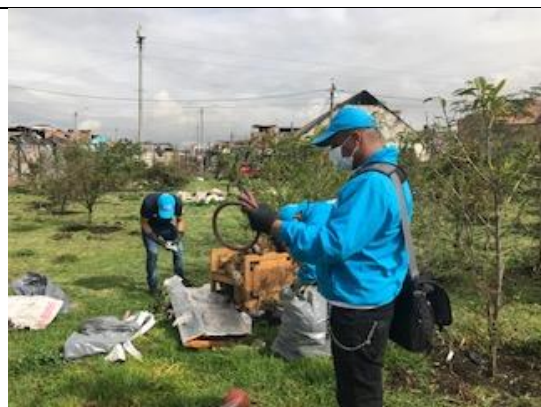
Foto 94: Jornada de limpieza con el grupo de SDIS y Corabastos en el sector de puerta 6 de Corabastos. Fecha: 26/04/2018