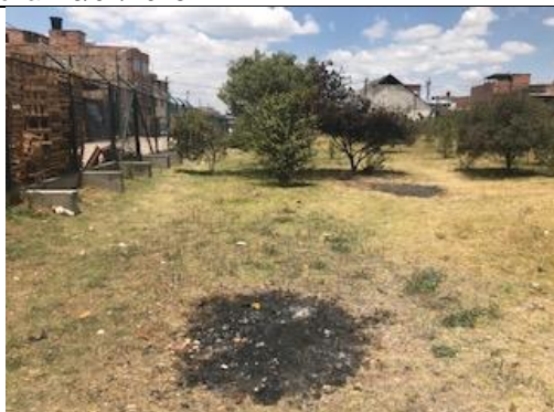
Foto 104: Conato provocado por el mismo habitante de calle. Fecha: 06/03/2018.