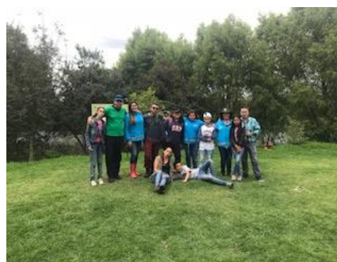
Foto 18: Participación del grupo Catarsix, comunidad, los Guardianes del Agua y la SDA. Fecha: 29/04/2018.