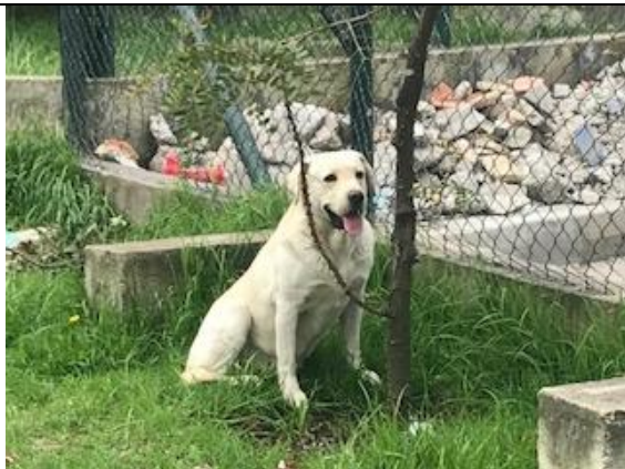
Foto 60: Identificación de canino dentro del humedal, sector Fecha: 18/04/2018