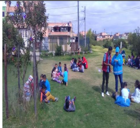
Foto 32: Celebración día Mundial de los humedales, con el apoyo de Ciudad Limpia. Fecha: 02/02/2018