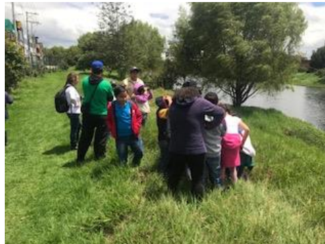
Foto 16: Capacitación del uso de la aplicación del Reto Naturalista Fecha: 29/04/2018.