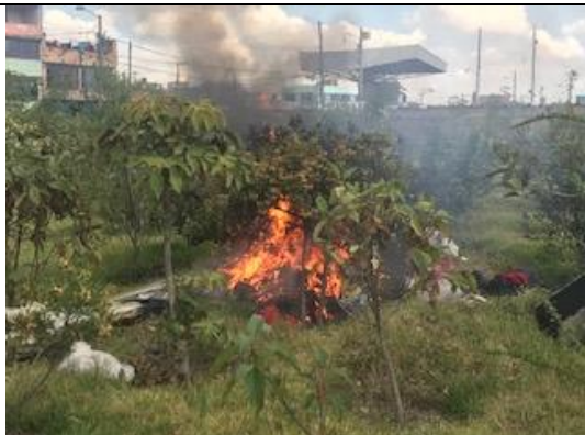
Foto 102: Conato provocado por habitante de calle en el sector de puerta 6 de Corabastos. Fecha: 26/02/2018