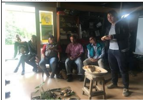
Foto 122: Mesa Territorial Mesa territorial del mes de noviembre, compartir realizado por Cosnpiración. Fecha:07/11/2018