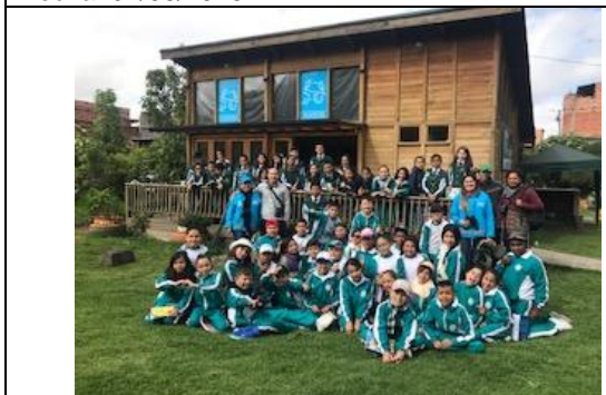
Foto 56: Censo Neotropical de aves acuáticas con la participación del colegio El Futuro del Mañana Fecha: 19/07/2018.