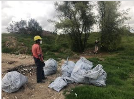
Foto 100: Jornada de limpieza y recuperación del Ingreso al humedal La Vaca, sector norte Fecha: 03/09/2018