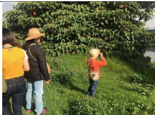
Foto 19: Monitoreo comunitario con la organización Nokanchipa Fecha: 29/11/2018