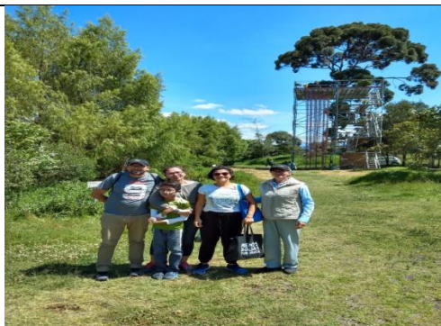
Foto 29 : Recorrido con comunidad con el proyecto Nidos. Fecha: 08/12/2018.