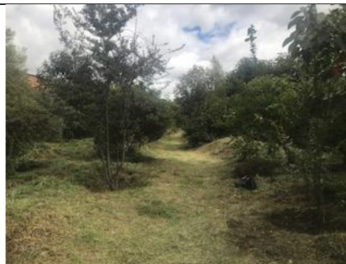
Foto 87: Plateos y aclareos en la Zona de preservación. Fecha: 26/01/2018.