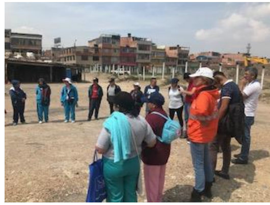
Foto 22: Apoyo al recorrido del EAB-ESP (Migra, recorre y conoce los humedales) con la comunidad de los humedales Córdoba y Santa María del Lago.