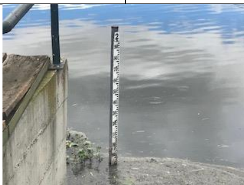
Foto 112: Mira No. 3 ubicada en el descole, sector 3 del humedal, medición de 80 cm. Fecha: 20/06/2018.