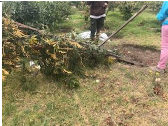
Foto 109: Mano de oso derribado por habitante de calle Fecha: 22/10/2018.