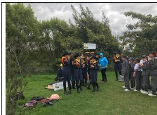
Foto 50: Celebración día de La Tierra: Participación del grupo de Carabineritos de Ciudad Bolívar y el apoyo incondicional de Corabastos con el aporte de refrigerios. Fecha: 26/04/2018