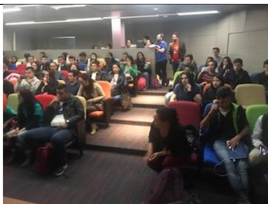
Foto 47: Público asistente al foro de humedales, realizado en el auditorio de la Universidad ECCI. Fecha: 15/03/2018.