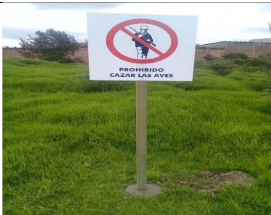
Foto 83: Instalación señalética tipo III (identificación de lugar), sector 3 del humedal La Vaca. Fecha: 09/06/2018