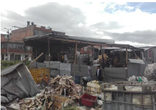
Foto 5: Actividad comercial de reciclaje dentro del humedal en el sector sur.