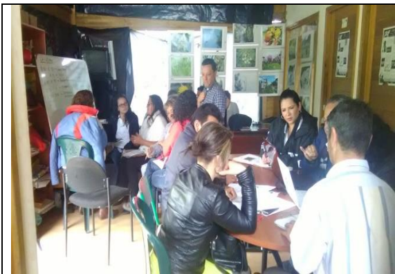
Foto 44: Taller con el grupo de Gestión de la Agenda Interlocal Bosa Kennedy, tema abordado: cómo defender los humedales. Fecha: 11/04/2018.