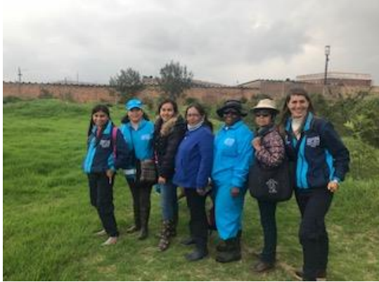
Foto 21: Recorrido interpretativo en el humedal La Vaca, con el grupo del IDRD.

ALCALDÍA MAYOR DE BOGOTÁ D.C. SECRETARÍA DE AMBIENTE