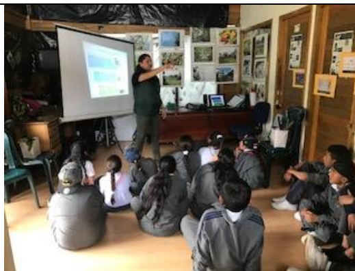
Foto 45: Taller de sensibilización sobre el manejo de residuos sólidos, por Ciudad Limpia. Fecha: 10/03/2018.