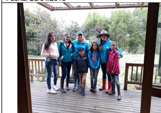
Foto 52: Participación en el Reto Naturalista, uno de los grupos ubicado en el sector 3 del humedal. Fecha: 29/04/2018