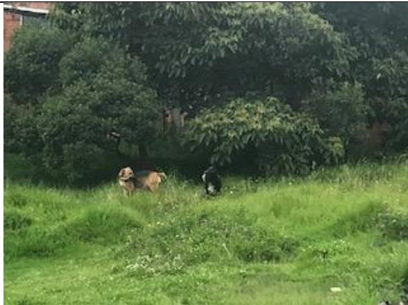
Foto 62: Identificación de caninos dentro del humedal, sector 3 Fecha: 30/05/2018