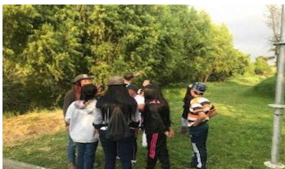
Foto 30 : Recorrido con los Guardianes del Agua Fecha: 08/12/2018.