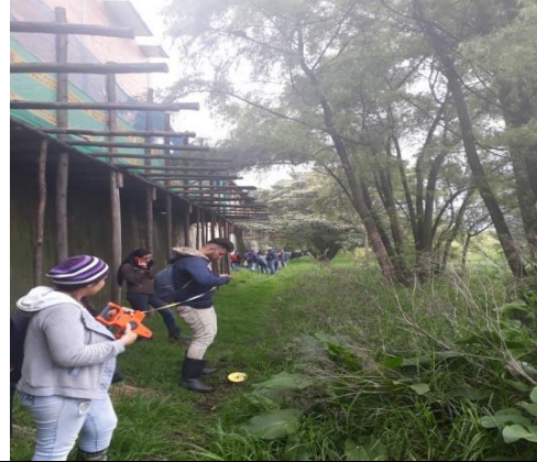
Foto 24: Recorrido Interpretativo, con el grupo de estudiantes de la Universidad ECCI. Fecha: 07/04/2018