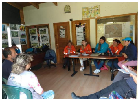
Foto 123: Mesa Territorial Mesa territorial del mes Diciembre, seguimiento a compromisos Fecha:04/12/2018