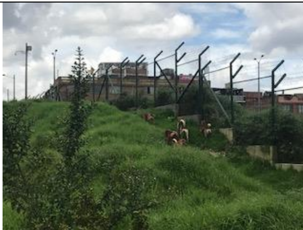
Foto 61: Identificación de caninos dentro del humedal, sector 1 hacia la avenida Agoberto Mejía Fecha: 16/04/2018