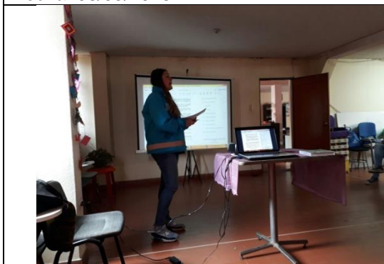
Foto 121: Mesa Territorial Mesa territorial del mes Mayo, continuación con construcción del plan de acción de la mesa territorial del humedal La Vaca. Fecha:08/05/2018