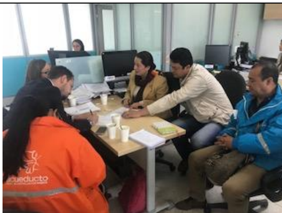
Foto 79: Reunión en la Alcaldía Local de Kennedy, con los profesionales de la ALK, EAB-ESP y la SDA para generar acciones en la recuperación del espacio del sector sur del humedal La Vaca. Fecha: 19/04/2018