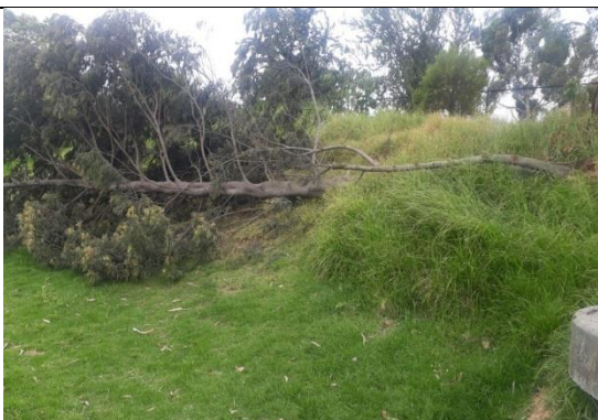
Foto 106: Acacia sobre sendero interpretativo sector 1 del humedal.