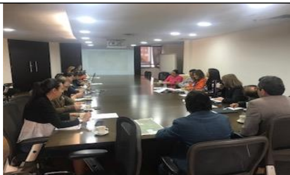
Foto 125: Reunión interinstitucional para la recuperación del PEDH La Vaca sector sur en las instalaciones de la SDA, participación del EAAB-ESP, ALK, Secretaría de Gobierno, Procurador y la SDA. Fecha:09/11/2018