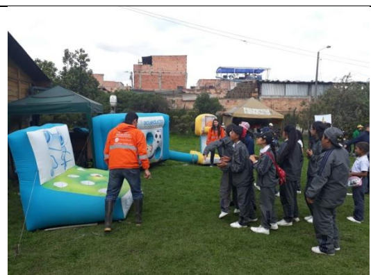
Foto 51: Celebración día de La Tierra Actividades lúdicas desarrolladas por el EAB-ESP a los estudiantes del Colegio SaludCoop Sur. Fecha: 26/04/2018.