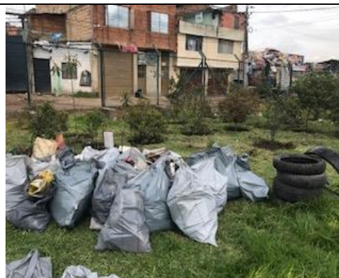
Foto 97: Se recolectaron 12.5 m 3 de residuos sólidos en el sector de puerta 6 de Corabastos. Fecha: 26/04/2018