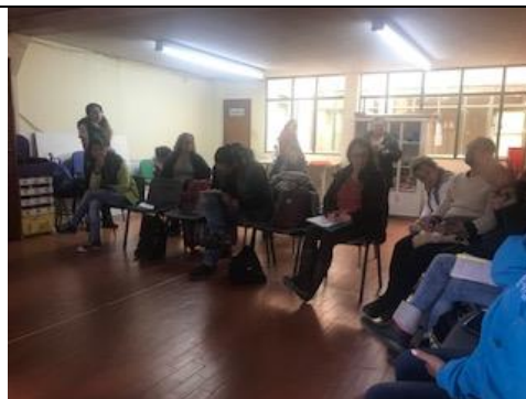
Foto 120: Mesa territorial del mes de Abril, inicio de la construcción del plan de acción de la mesa territorial del humedal La Vaca Fecha: 03/04/2018