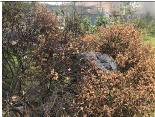
Foto 103: Muerte de individuo arbóreo después de conato. Fecha: 27/02/2018