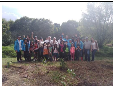
Foto 57: Jornada de siembra participativa con la Personería, ALK y la Comunidad Fecha: 20/10/2018.