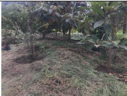
Foto 90: Plateos y aclareos de individuos arbóreos Fecha: 13/03/2018.