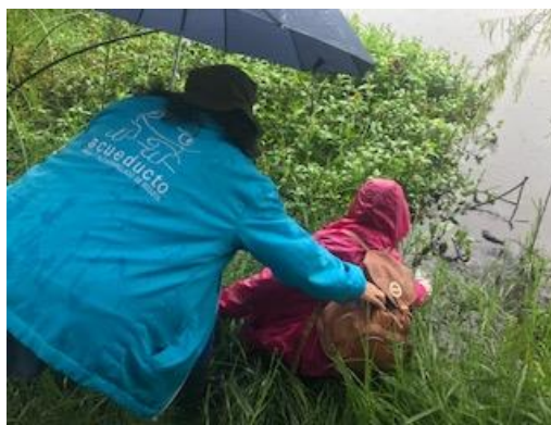
Foto 10: Toma de muestra de agua, sector 3 del humedal costado sur.