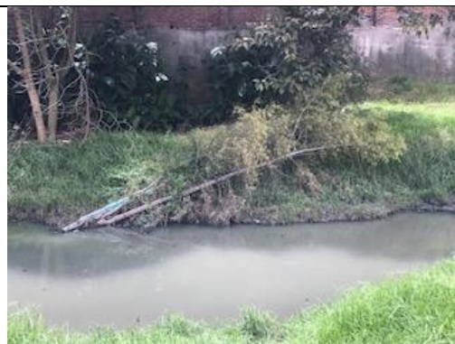
Foto 107: Sauce llorón que cayó sobre la laguna de sedimentación. Fecha: 22/05/2018