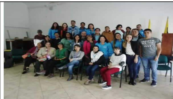
Foto 124: Ultima mesa de la CAL del año 2018, presentación de la ejecución del plan de acción del año y compartir de despedida de año. Fecha:06/12/2018