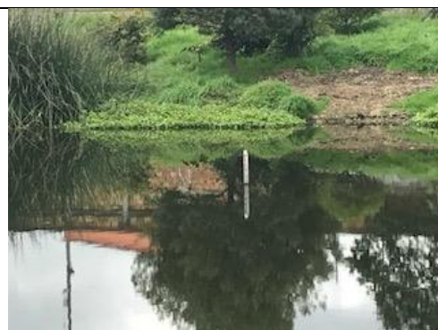
Foto 111: Mira No.2 ubicada en la laguna natural del humedal, sector 3 del humedal, medición 2.4 m Fecha:20/06/2018