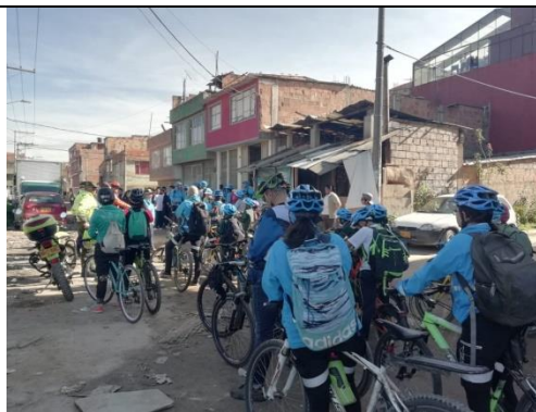
Foto 55: Bicirecorrido por los humedales de Kennedy, llegada a la primera estación sector sur del humedal La Vaca Fecha:07/06/2018