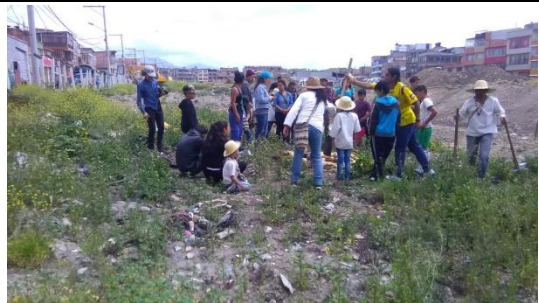
Foto 25: Recorrido Interpretativo y toma Cultural organizaciones. Fecha: 11/02/2018.