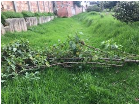
Foto 108: Arboloco sobre zona de preservación del humedal. Fecha: 15/06/2018