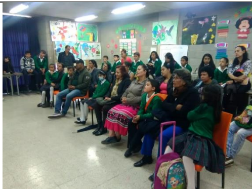
Foto 43: Acción Pedagógica realizada en el Colegio INEM de Kennedy, Eco taller de biodiversidad Fecha: 01/11/2018.

Foto 41 y 42: Acción Pedagógica realizada en el Colegio Saludcoop Sur, en el marco de la celebración día de la tierra con los cursos 402, 501, 603, 302 y 301. Fecha: 18/04/2018.