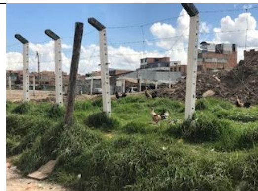
Foto 58: Identificación semovientes (gallos de pelea) sector sur del humedal La Vaca. Fecha: 18/06/2018