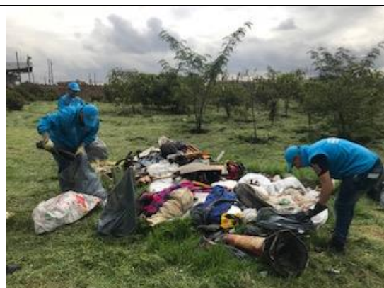
Foto 95: Recolección de residuos generados por habitantes de calle Fecha: 26/04/2018