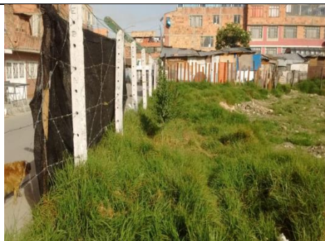
Foto 92: área invadida por pasto kikuyo sector sur del PEDH Fecha: 07/11/2018