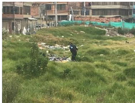
Foto 6: Contaminación de suelos por descargas continuas de residuos sólidos y RCD's