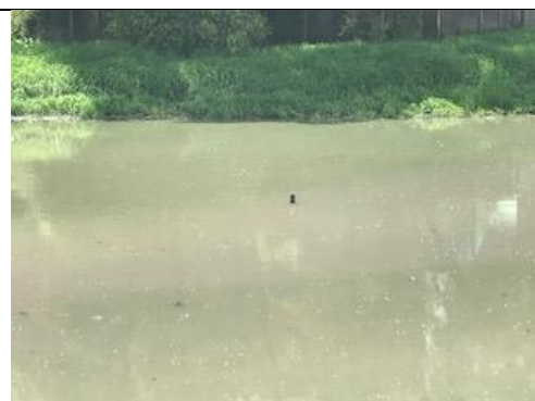
Foto 110: Mira No.1 ubicada en la laguna de sedimentación, sector 1 del humedal, medición 1.95 m. Fecha: 20/06/2018