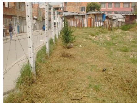
Foto 93: Despeje del área colindante al cerramiento provisional sector sur del PEDH Fecha: 09/11/2018