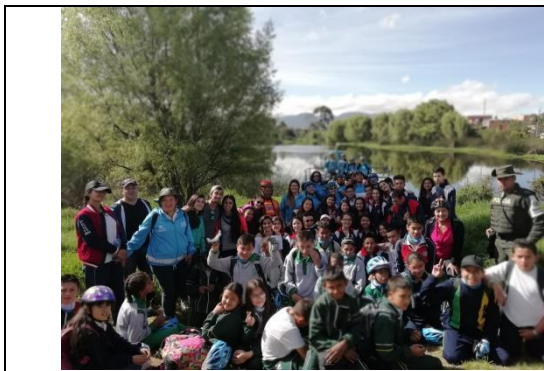
Foto 54: Bicirecorrido por los humedales de Kennedy, eje temático de la estación: recuperación (sector sur) y conservación (sector norte) por el equipo de la SER/SDA. Fecha: 07/06/2018