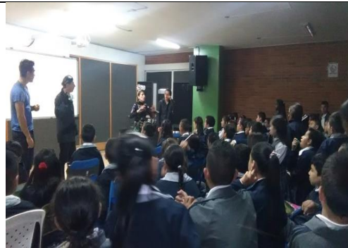
Foto 41 y 42: Acción Pedagógica realizada en el Colegio Saludcoop Sur, en el marco de la celebración día de la tierra con los cursos 402, 501, 603, 302 y 301. Fecha: 18/04/2018.