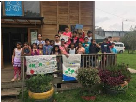
Foto 35: Celebración Día de los niños – Comedor Comunitario y Guardianes del Agua. Fecha: 05/05/2018