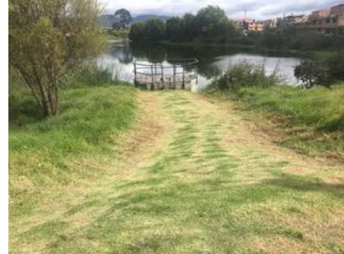
Foto 89: Despeje de senderos sector 3 del humedal (descole) Fecha: 31/01/2018.