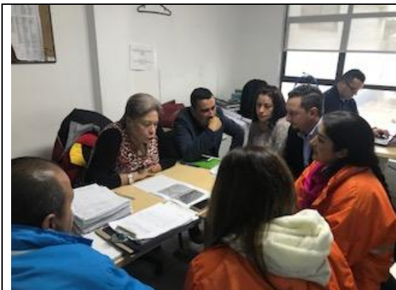
Foto 78: Reunión en la Alcaldía Local de Kennedy, con los profesionales de la ALK, EAB-ESP y la SDA para generar acciones en la recuperación del espacio del sector sur del humedal La Vaca. Fecha: 07/05/2018