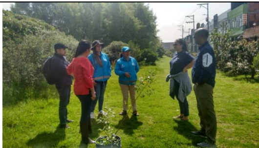
Foto 28 : Recorrido con los docentes de la Universidad Nacional y Connecticut de USA Fecha: 18/10/2018.