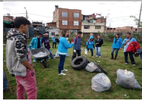
Foto 101: Jornada de limpieza y recuperación del Ingreso al humedal La Vaca, sector norte Fecha: 23/10/2018