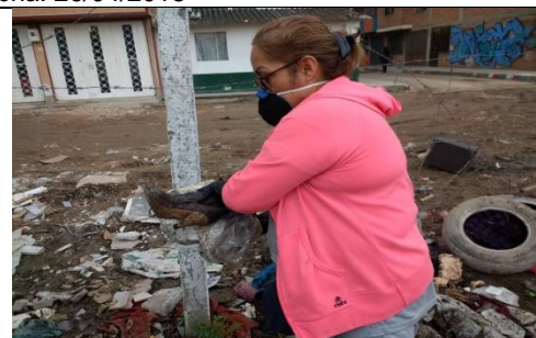
Foto 99: Jornada de limpieza con la comunidad del barrio Villa de la Torre, en el sector sur del humedal. Fecha: 10/03/2018