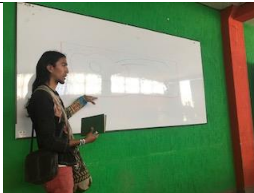
Fotos 64 y 65: Primera reunión realizada para el diseño conjunto del sector sur del humedal, donde se