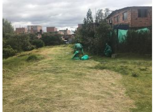
Foto 88: Despeje de senderos sector 3 del humedal Fecha: 31/01/2018.