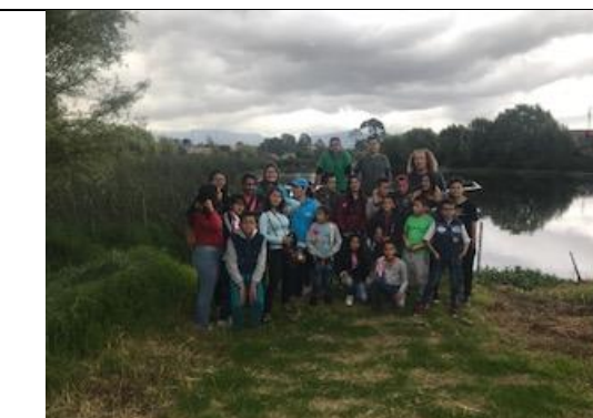
Foto 53: Participación en el Global Big Day, con la asistencia de los grupos Catarsix, Puntos Cardenales, Guardianes del Agua y la SDA. Fecha: 05/05/2018