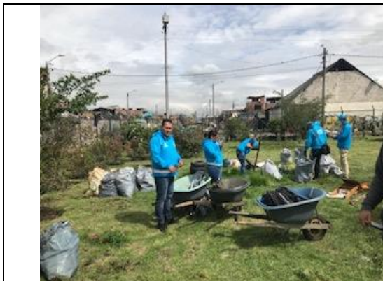
Foto 96: Apoyo a la jornada de limpieza del equipo de los humedales de Kennedy de la SDA. Fecha: 26/04/2018