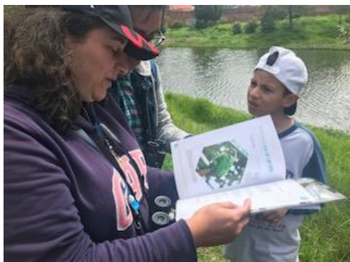
Foto 17: Identificación de especie por el grupo de monitoreo de la SDA. Fecha: 29/04/2018