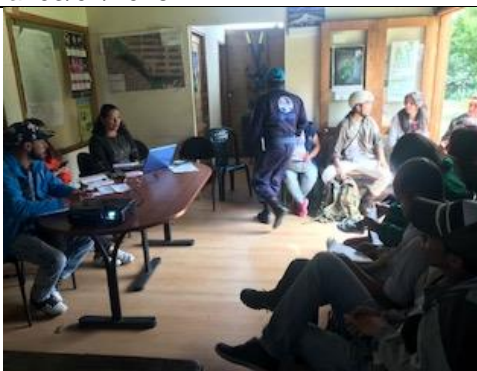
Foto 121: Mesa territorial del mes de junio donde se recopiló la percepción de la socialización de declaratorias del complejo de humedales para Ramsar. Fecha : 05/06/2018