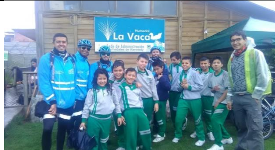
Foto 26: Recorrido Interpretativo con la Secretaria de Movilidad y un grupo de estudiantes del colegio Paulo VI en el marco del programa "Al colegio en Bici". Fecha: 06/04/2018.