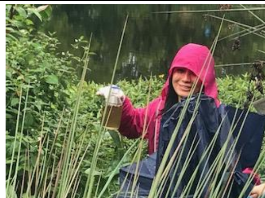
Foto 8: Toma de muestra de agua en la Laguna Natural sector 3 del humedal.