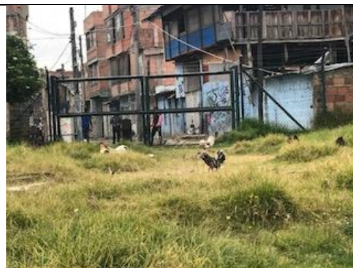
Foto 59: Identificación de galpones ubicados en el sector sur del humedal La Vaca. Fecha: 22/05/2018