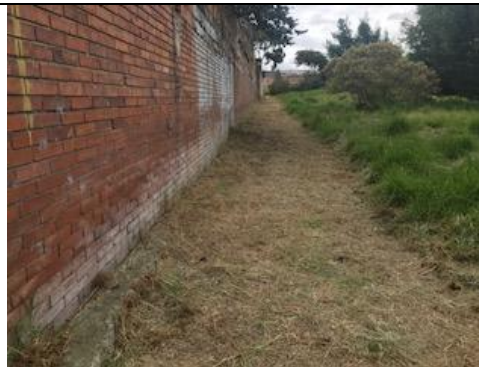
Foto 91: Despeje del área colindante al muro de Corabastos. Fecha: 13/03/2018.