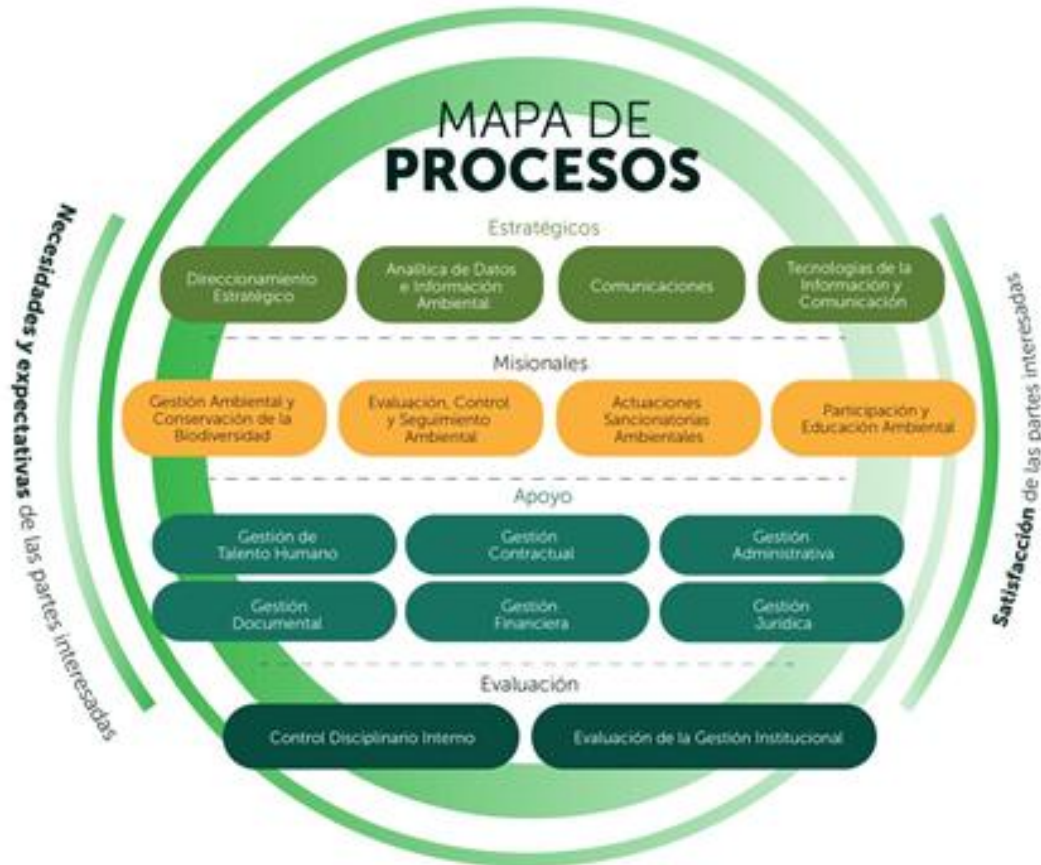
Ilustración 1 Mapa de procesos