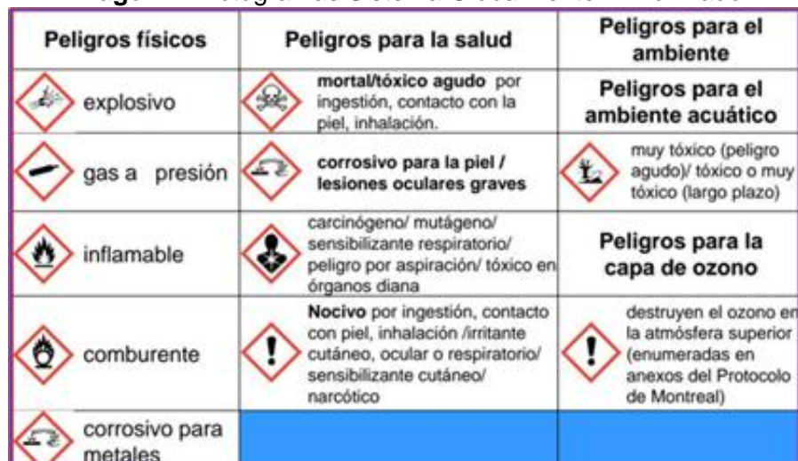
Imagen 4: Pictogramas Sistema Globalmente Armonizado

El cual será acorde a las características de la sustancia y en referencia a la Ficha de Datos de Seguridad y el Sistema Globalmente Armonizado, se muestran a continuación: