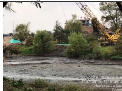
Foto 16: Revisión extracción de lodos de la laguna de sedimentación.