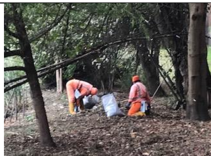
Foto 15: Recolección de residuos sólidos por parte de franja acuática de AB, en el sector 1 del PEDH.