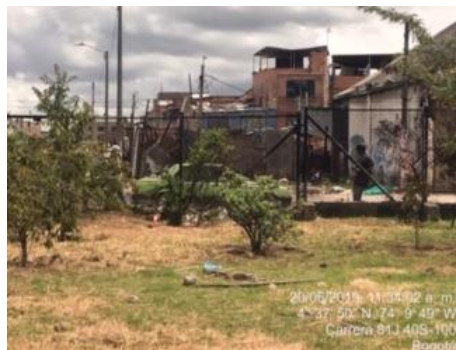
Foto 3: Presencia de residuos sólidos dentro del área del humedal.