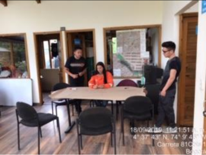
Foto 9: Avances CIC temas abordados: objetivos, problemáticas y alinderamiento del PEDH.

En cumplimiento del modelo de administración para el Parque Ecológico Distrital La Vaca, se realizan acciones que propenden fortalecer la educación ambiental en el marco de la protección, conservación y cuidado del ecosistema por medio de recorridos interpretativos, dirigidos a colegios, universidades comunidad y organizaciones no gubernamentales, para el periodo comprendido se atendieron 8 recorridos con la participación de 232 personas, entre estos se menciona recorridos con los niños y niñas de la asociación de jardines del Amparo del ICBF, la organización Ardec, caminatas ecológicas del IDRD. entre otros.