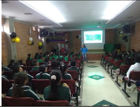
Foto 12: Abordaje a los estudiantes de noveno del Colegio San Bonifacio, tema Generalidades de Humedales.

En el periodo comprendido se realizó 1 acción en el colegio San Bonifacio, comprendido en 3 sesiones donde se abordaron 320 estudiantes del grado quinto, noveno, decimo y vigías ambientales.