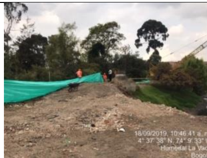
Foto 14: Revisión protección de los individuos arbóreos por mantenimiento de la laguna de sedimentación.