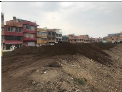
Foto 13: Revisión del sustrato para el mejoramiento de suelo del sector sur del PEDH.

Por otro lado se realizó acompañamiento a la verificación del mantenimiento que se está realizando en la laguna de sedimentación, extracción de lodos para el traslado al sector sur para el mejoramiento de suelo.