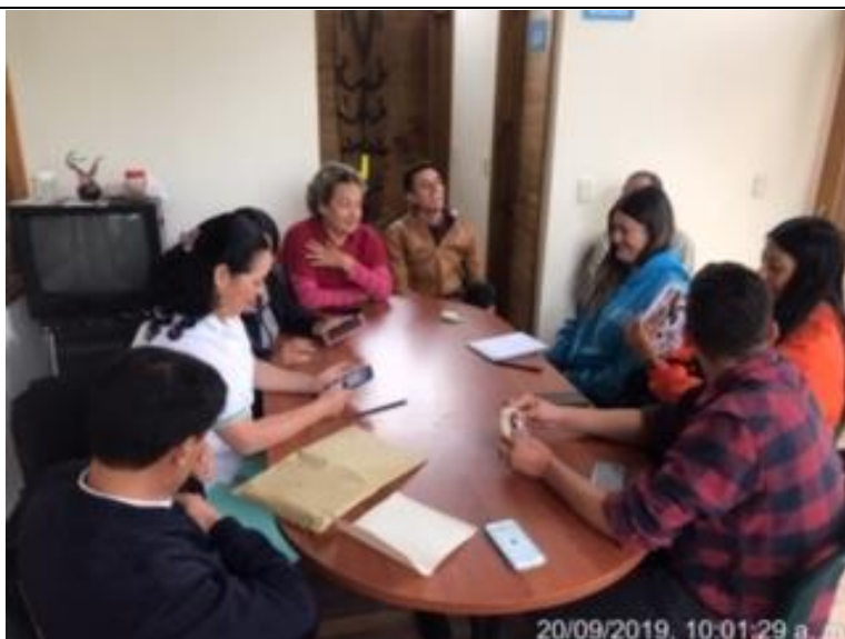
Foto 17: Visita por parte de la Contraloría revisión tema predio Monteverde.