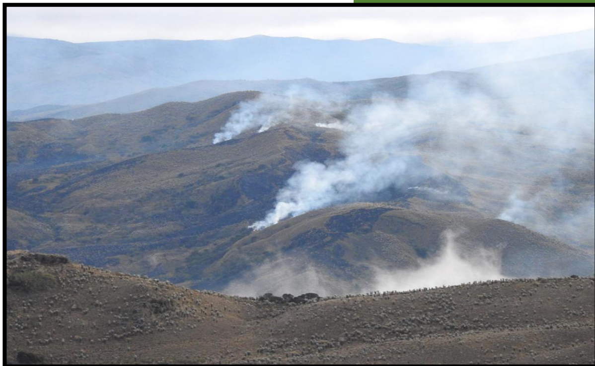
Fotografía 1. Incendio forestal - VEREDA LAS SOPAS

GRUPO GESTIÓN DEL RIESGO POR INCENDIO FORESTAL