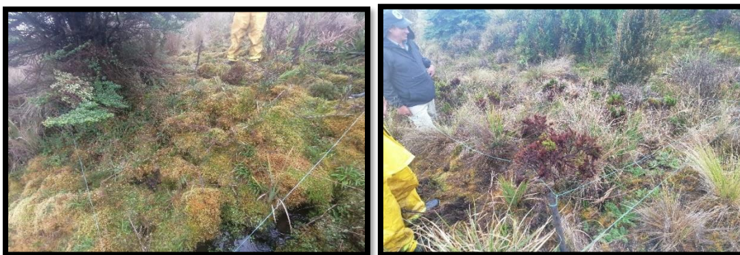
Fotografías 4 y 5: Parcelas montadas en cobertura herbazal de tierra firme con arbustos.

Para la categoría de brinzales, dentro de cada parcela latizal, se levantaron dos (2) parcelas de muestreo de 2 m x 2 m, es decir 4 m 2 , en las que se hizo el inventario de individuos con alturas entre 0,3 m y 1,5 m.