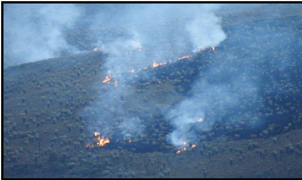
Fotografía 2: Incendio forestal en la vereda Las Sopas.

El incendio forestal ocurrido en la vereda Las Sopas de la localidad de Sumapaz duró un (1) día; inició el 13 de diciembre de 2020 hacia las 13:48 horas y se apagó completamente en horas de la madrugada del día siguiente, debido a las bajas temperaturas. Dicho evento afectó 24,71 ha de vegetación de páramo dominada por frailejonal y fue de tipo superficial.