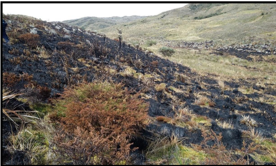
Fotografía 3: Área de páramo afectada por el incendio forestal.

Hidrográficamente, el área afectada se ubica en la cuenca del Río Blanco, subcuenca Río Chochal, microcuenca Quebrada Andabobos. Posee un relieve característico de alta montaña, destacado por sus ondulaciones, con pendientes que van de los 12 a los 50 grados, suelos que se desarrollan en rocas clásticas arenosas, profundos, bien drenados, de texturas gruesas, superficiales y limitados por fragmentos de roca. Entre las cotas 3500 y 3900 m.s.n.m. se presenta un ecosistema de páramo propiamente dicho, caracterizado por cobertura de gramíneas en la que predominan frailejones del género Espeletia dominados principalmente por la especie Espeletia grandiflora ; en áreas colindantes es posible identificar especies como Espeletia sumapacis , Espeletia argenta o Espeletia killipi . Adicionalmente, se encuentra ecosistema de subpáramo, que se caracteriza por el predominio de la vegetación arbustiva y matorrales dominados por las familias Asteraceae y Ericaceae .