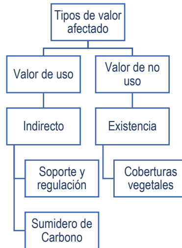
Imagen 2. Tipos de valor afectado por el incendio forestal.

De igual manera, se excluyó el valor indirecto de salud, pues no se reportaron afectaciones a la vida humana y los reportes de calidad de aire no mostraron cambios relevantes.