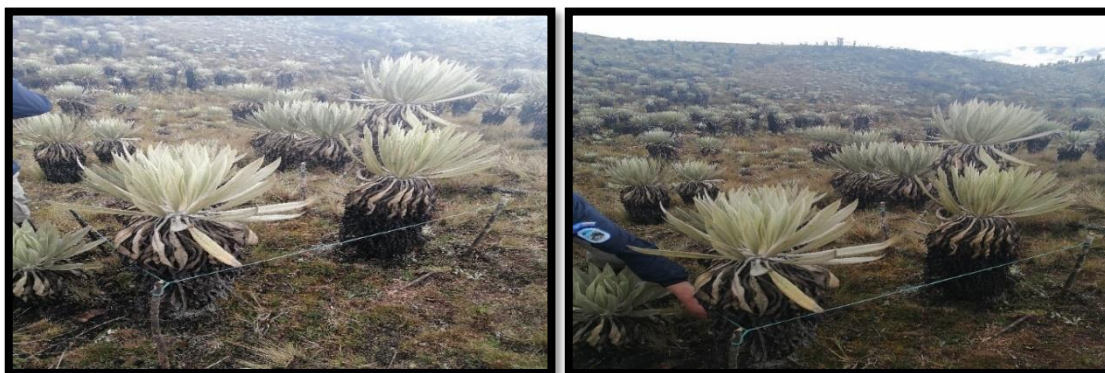
Fotografías 6 y 7: Parcelas montadas en cobertura herbazal de tierra firme no arbolado

En el área testigo y en el área de borde de brinzales se hizo el levantamiento de seis (6) parcelas temporales (PT) de 1 m x 1 m, es decir 1 m 2 ; en las que se hizo el inventario de los individuos de biotipos herbáceos.